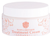
▲(株) The St Monica (札幌市) 天然馬油保湿クリーム白樺樹液入り