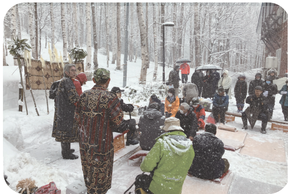
～ 2023 大雪の中でカムイノミ～