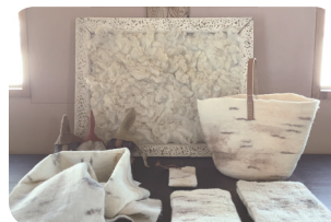
▲粗清草堂・羊毛作品

2015 年、美深町辺浜で羊毛工房開業。身近な羊たちの羊毛を主役に、フェルトの作品を作っています。今回は、白樺染め、白樺模様の作品を中心に店出します。